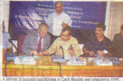
A seminar on business opportunities in Czech Republic was organized by EPEPC and IIA at IIA Bhawan.